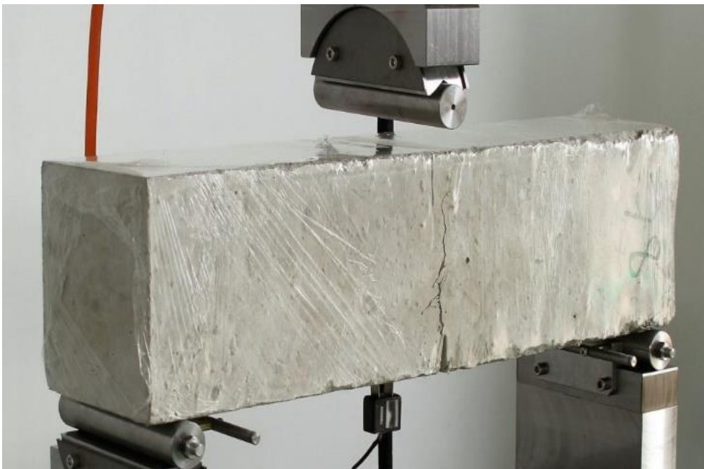
FIGURA 2 – TESTE DO MATERIAL