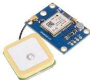
Imagem 3 - Módulo GPS