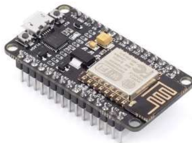
Imagem 2 - NodeMCU Esp-12e

Este microcontrolador será responsável pela detecção e sinalização de um furto em ocorrência, ou seja, ao detectar o desligamento de qualquer parte do circuito a função anti-furto será acionada. Os dados que o microcontrolador deverá comunicar são a localização, horário do furto e o número de série do poste de luz. Para que essa comunicação seja possível será utilizado um módulo GPS que é capaz de obter todos estes dados em tempo real.