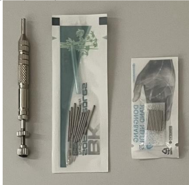
Figura 2 – Aplicador e agulhas para acupuntura.

Essa sensação pode ser descrita como dor, peso ou parestesia, e reflete a ativação das fibras nervosas aferentes. A eficiência do tratamento está relacionada à intensidade do estímulo, que está diretamente ligada à frequência com que a sensação de "De Qi" é alcançada (ALMEIDA, 2013).