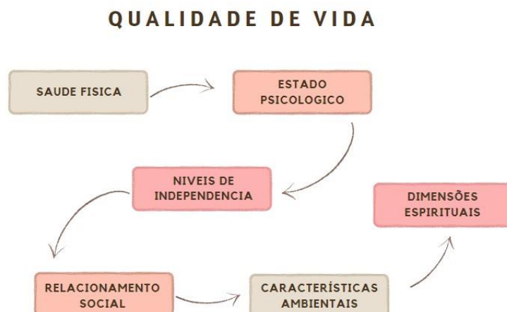
Figura 1 – Domínios da Qualidade de Vida.