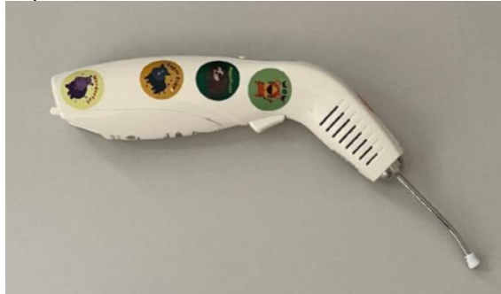
Figura 4 – Aparelho Laser Acupuntura.

Os pontos de acupuntura são estimulados por meio de laser de baixa intensidade (Figura 3) na Laser Acupuntura ou Acupuntura a laser, que é mais uma opção para os indivíduos que não toleram as tradicionais agulhas (VALENTE, 2015).