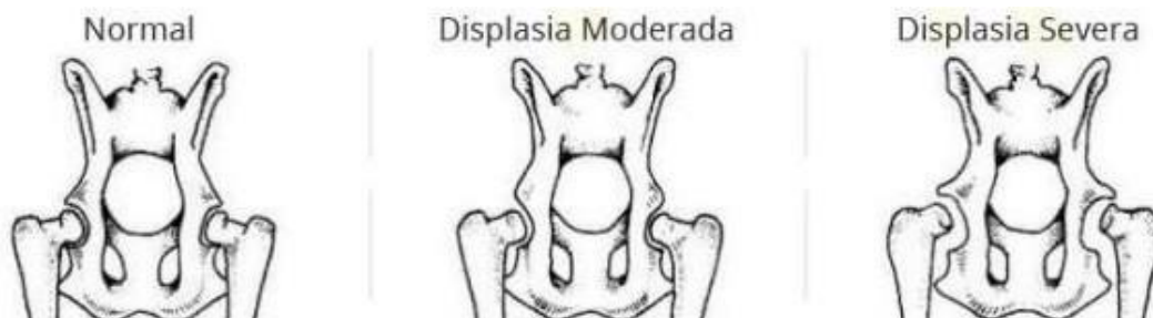
Imagem 2 – Imagem ilustrativa dos diferentes tipos de grau da DCF (não usar cigras em imagens)

Além dos tratamentos convencionais oferecidos por profissional veterinário em consultório, há demais opções terapêuticas para amenizar a dor que o animal sente, como acupuntura, hidroterapia e demais práticas terapêuticas alternativas. Além disso, recomenda-se o uso controlado de fármacos, especialmente anti-inflamatórios e condoprotetores que auxiliam na produção de cartilagem e mitigação da degradação do colágeno. A intervenção cirúrgica é recomendável apenas em casos avançados de displasia (COLVERO et al , 2020).