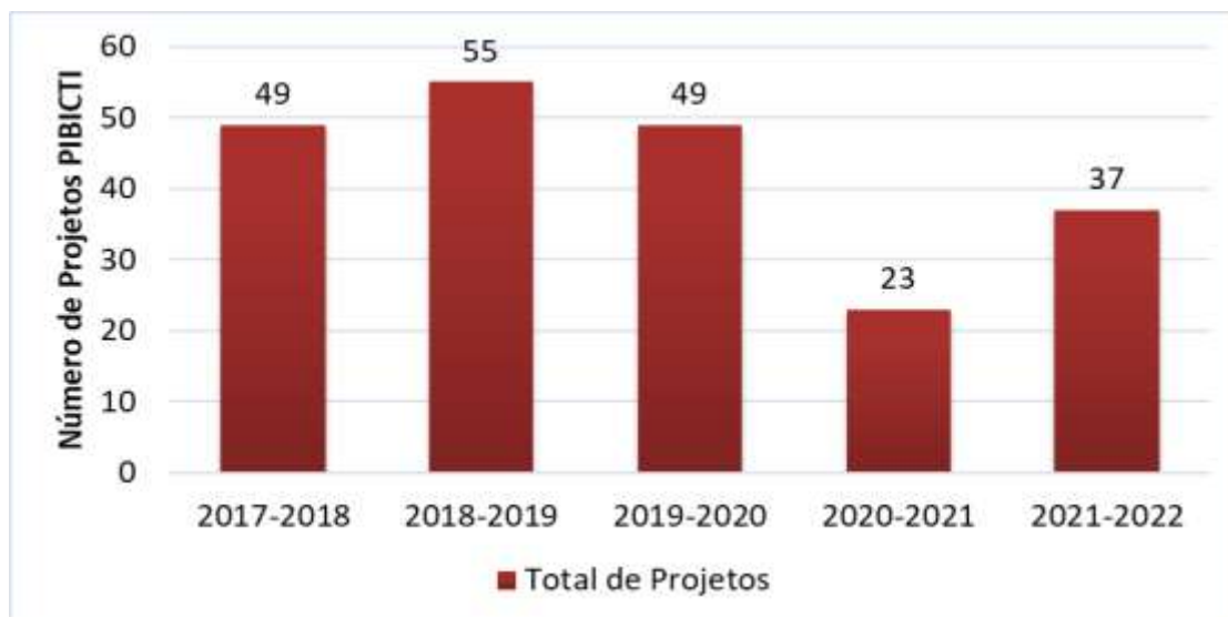
Figura 1 - Projetos de Iniciação Científica, Tecnológica e de Inovação, no período de 2017 a 2022.

Ao longo dos anos, foram distribuídas entre os projetos, bolsas de Iniciação Científica pela Faculdade Brasileira Multivix Vitória através do PIBICES-FAPES, entretanto, em 2019, com a finalidade de despertar a vocação científica, tecnológica e de inovação entre os estudantes de graduação da Faculdade Brasileira Multivix Vitória, considerando as mais diversas áreas do conhecimento e especialidades, contribuir para a promoção de padrões de excelência e eficiência na formação de recursos humanos na instituição, foi criado Programa Institucional de Iniciação Científica, Tecnológica e de Inovação da Faculdade Brasileira/Multivix Vitória (PIBICTI) (Portaria nº 048 de 26 de DEZEMBRO de 2019), que passou a conceder quotas de bolsas institucionais conforme a Portaria Nº 049 De 30 De Dezembro De 2019.