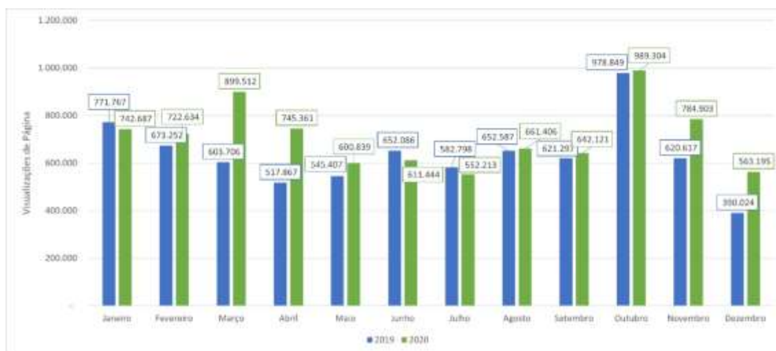
Figura 3 – Acessos do Site Institucional 2019-2020

Por conta de uma melhor estruturação do Setor de Marketing foi possível obter um aumento de matérias da Faculdade Brasileira veiculadas na mídia regional e nacional; a melhoria da comunicação interna; e a forte presença nas mídias sociais, que resultou em uma maior ligação com os estudantes. A aproximação da Instituição com seus públicos estratégicos pode ser medida também por meio do aumento de acessos ao site Instituição e por outros meios de comunicação em redes sociais.