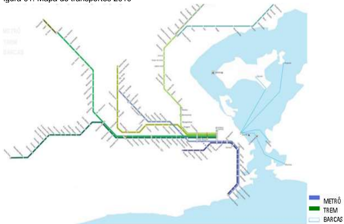
Figura 01: Mapa de transportes 2010